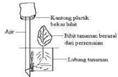
Gambar 3.1. Penanaman dengan menggunakan bibit

Saat penanaman sebaiknya polybag jangan dilepas, tetapi hanya dirobek bagian bawahnya saja supaya media tanam yang berupa lumpur tidak terlepas. Adapun contoh penanaman seperti gambar berikut 3.1: